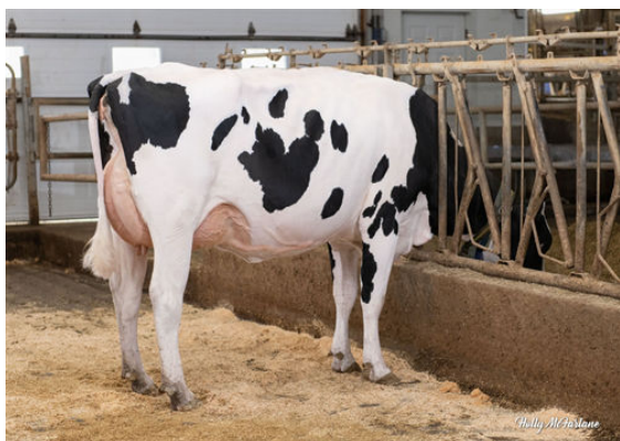
PROGENESIS CABOT MAYER DAM