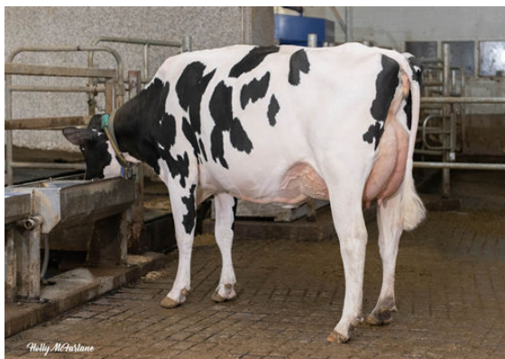
PROGENESIS CABOT MAYER DAM