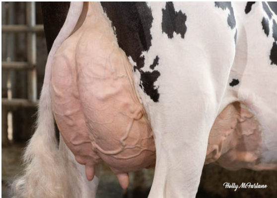
WESTCOAST ALCOVE RIZA 7512 DAM