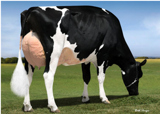
GOLDEN-ROSE RASBERRY THIRD DAM