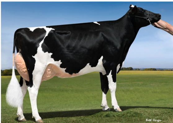
GOLDEN-ROSE RASBERRY THIRD DAM