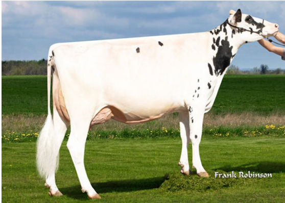
GDR-KINGS BAILEY 50878 DAM