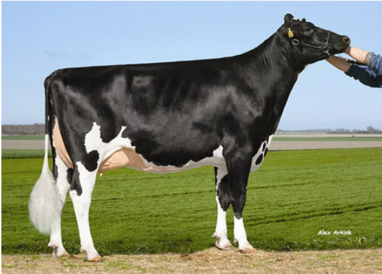
SHERAY 2 DAM