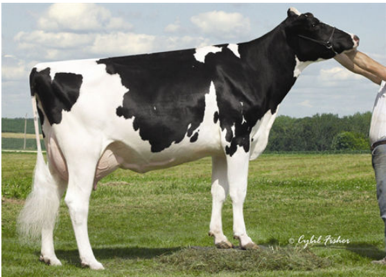
UFM-DUBS EROY THIRD DAM