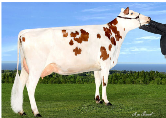
GUIMOND REVOLUTION DOMINANTE