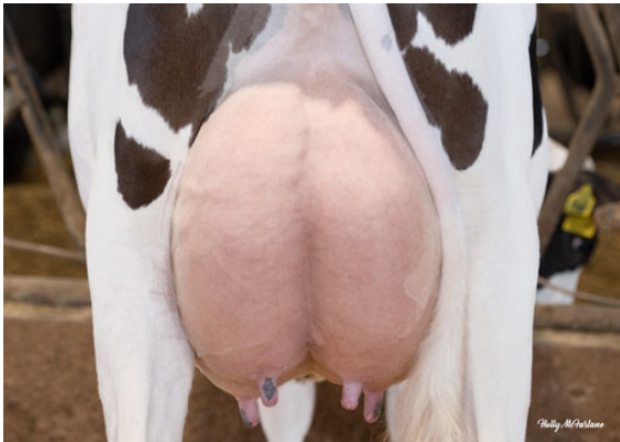
SANDY-VALLEY BORN2BOOGIE DAM