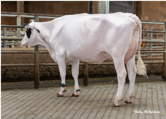
WESTCOAST ALGTR BTMNSKY 12380 DAM