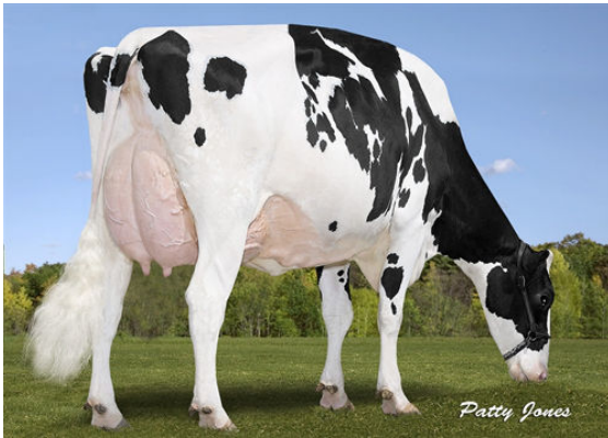
WALNUTLAWN DOORMAN BREANNA FOURTH DAM