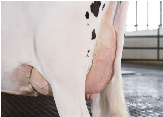
STANTONS TOPNOTCH TALENT