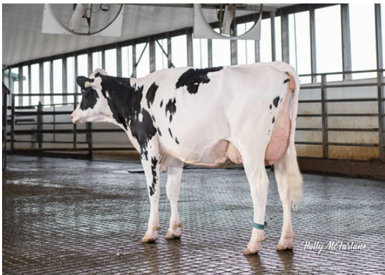
STANTONS TOPNOTCH TALENT