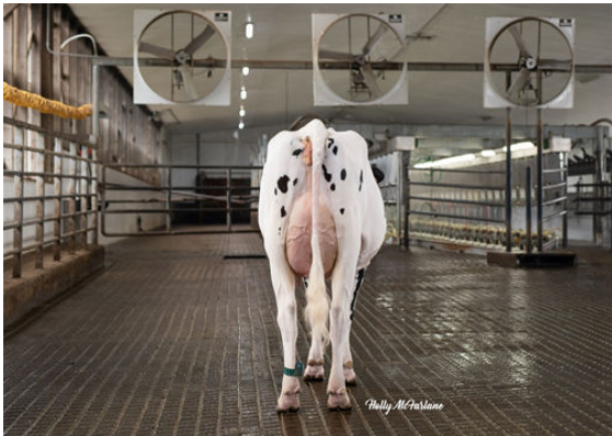
STANTONS TOPNOTCH TALENT