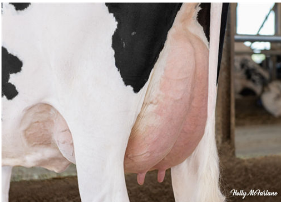
SILVERRIDGE V MARIUS EVICTION DAM