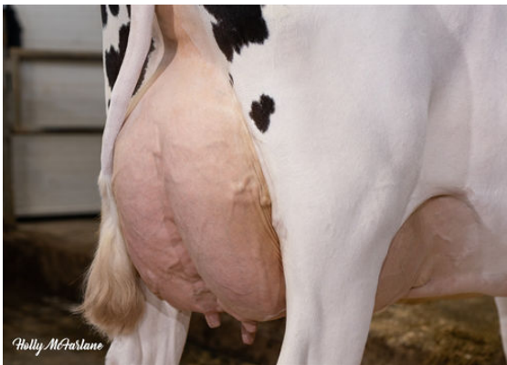
PROGENESIS JEDI MENACE GRANDDAM