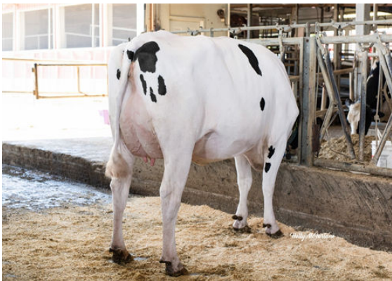
FB LULU ACHV VEGAS