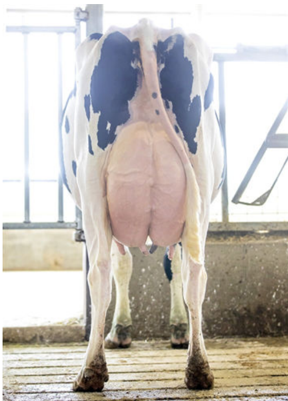
SIEMERS TRJ BROOKE 28030