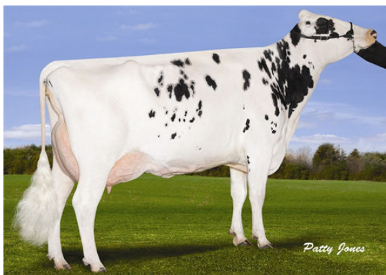
GEN-I-BEQ SHOTTLE BOMBI