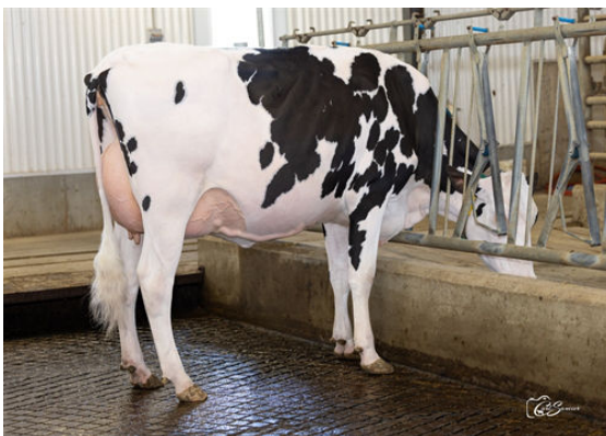
DUPORTAGE LAMBEAU IMONICA DAUGHTER