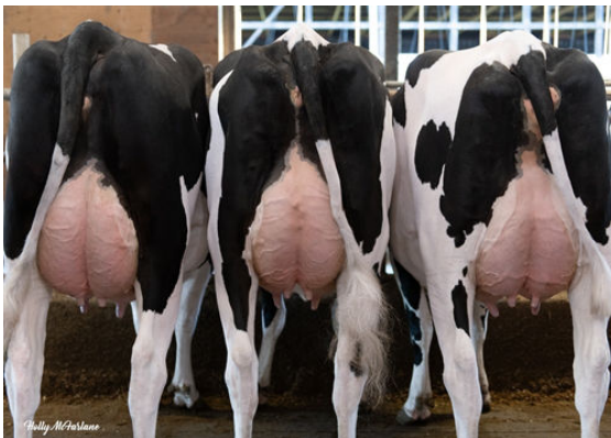
LAMBEAU DAUGHTER GROUP L TO R - WISSELVIEW LAMBEAU DIX, WISSELVIEW LAMBEAU DIXIELEE, WISSELVIEW LAMBEAU DIXEE