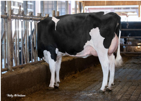
WISSELVIEW LAMBEAU DIX DAUGHTER