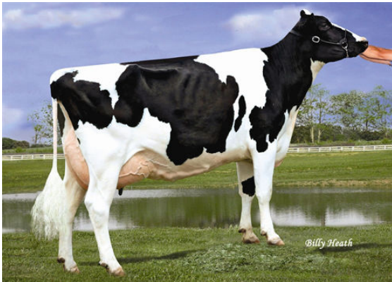
LADYS-MANOR RUBY D SHAWN FIFTH DAM