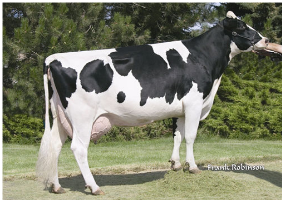
SEAGULL-BAY OMAN MIRROR