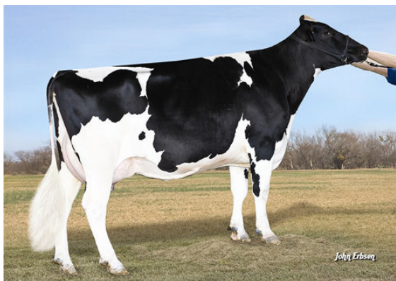
ROYLANE SHOT MINDY 2079