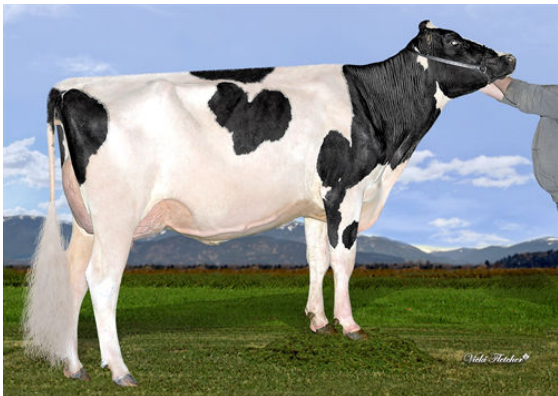
WESTCOAST POPSTR SIL6827 8977 DAUGHTER