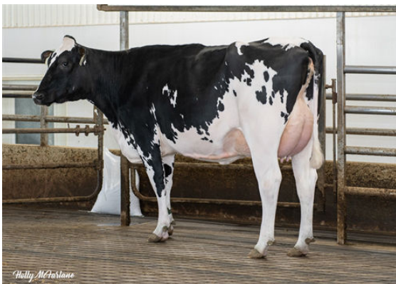
DAIRYDALE MILKTIME CHARLEY

L TO R - DRAGON MILKTIME 4204, DRAGON MILKTIME 4202, DRAGON MILKTIME 2236