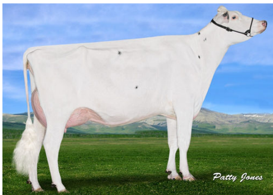
BLUE-HORIZON JCKMN BABYDUST