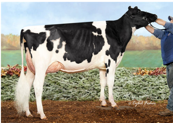
WESTCOAST ORION ARYANE 4727