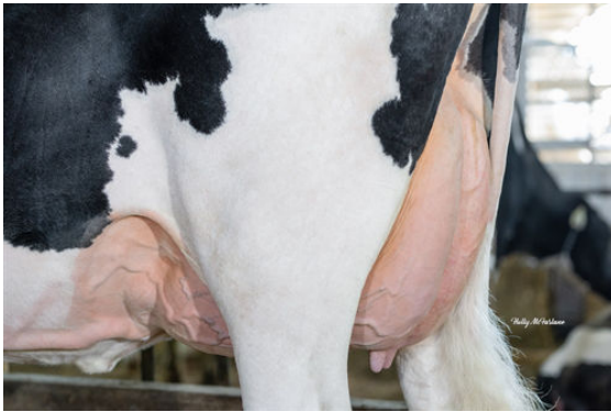
WALNUTLAWN ORION SUNSHINE