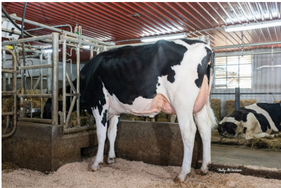
WALNUTLAWN ORION SUNSHINE