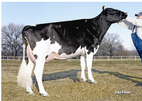
MISS ELEGANT DELIGHT