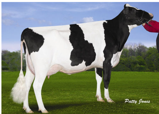
OCD PLANET DIAMOND