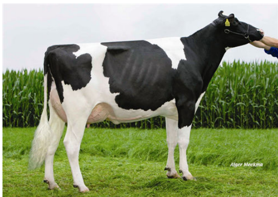
ZANDENBURG PLANET EBONY 3