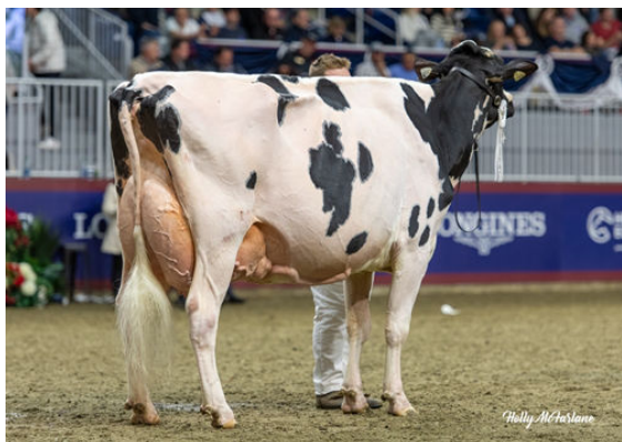
HUFFMANDEALE UNIX MAPLESUGAR DAUGHTER