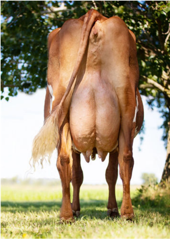
MARBRAE ARBITER'S CATALINA