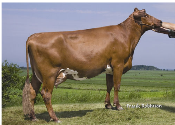
KAMOURASKA PETERSLUND RUBY