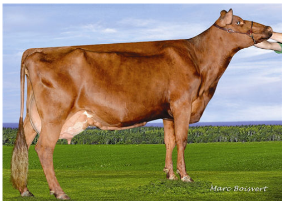
KAMOURASKA ORRA XUBY