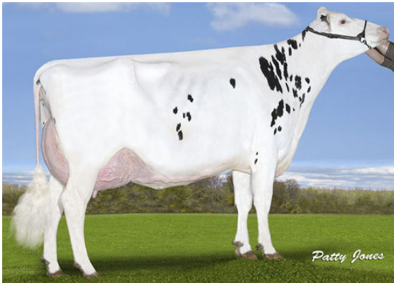
CALBRETT KINGBOY MIRANDA P THIRD DAM