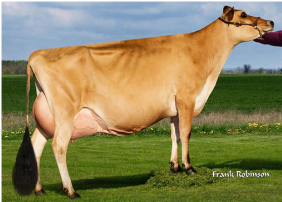
AHLEM CHIEF SOUVENIR 56603