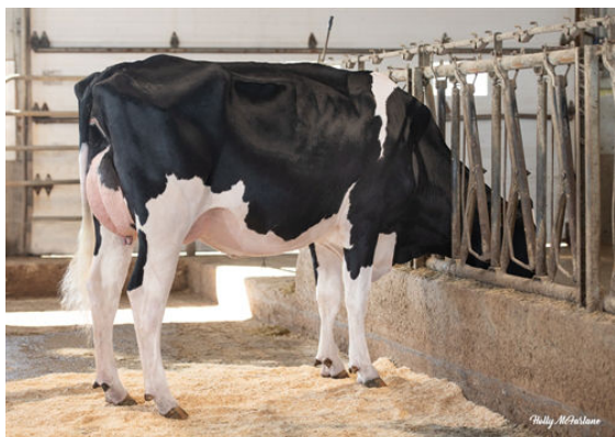
PROGENESIS RANGER KAYLYNN