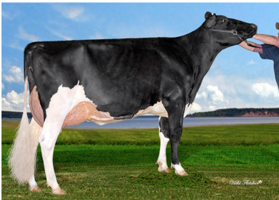
JACOBS UNIX BRILLANT