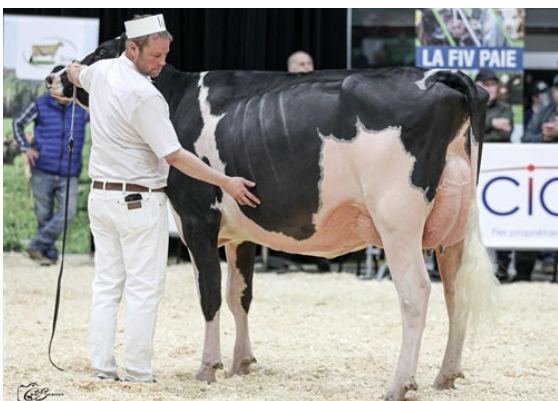
JACOBS LAMBDA BRIAR