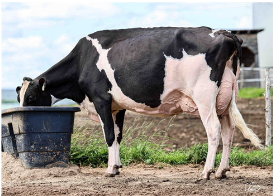
JACOBS LAMBDA BRIAR