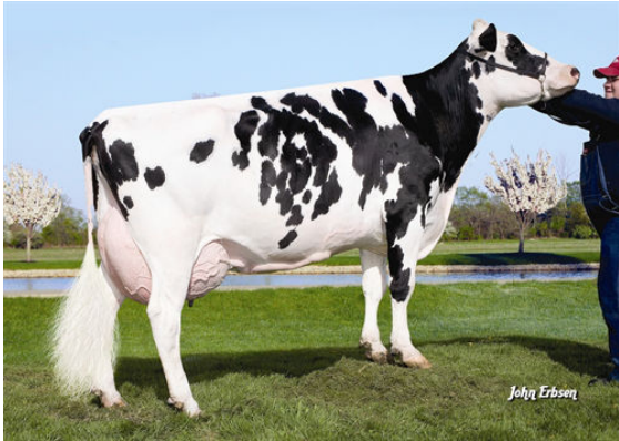
VATLAND O MAN MARY 2007 FIFTH DAM