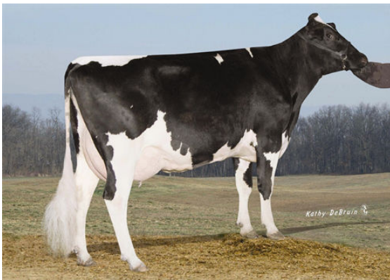
PINE-TREE MONICA SUELA FOURTH DAM