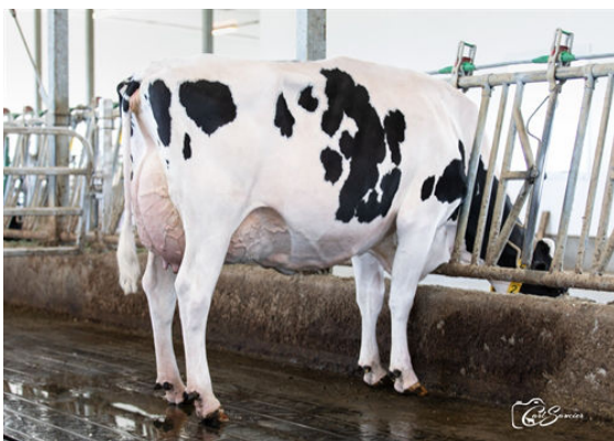
DUCHESNE FUEL SANDRINE DAUGHTER