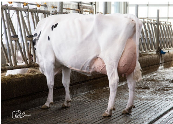
JAQUET FUEL ABISSA DAUGHTER