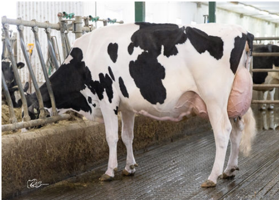
ANTIA FUEL MINOU DAUGHTER