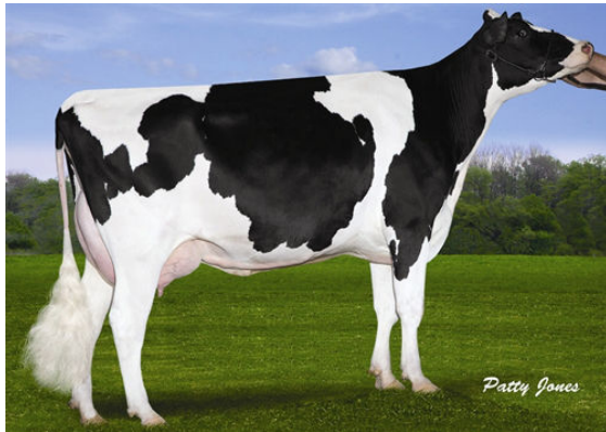
CLAYNOOK CHAR M O M