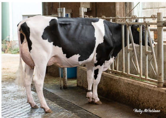
COOKIECUTTER FANCA HOCCO DAM