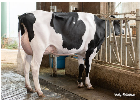
PROGENESIS ZAZZLE PRESTIGE