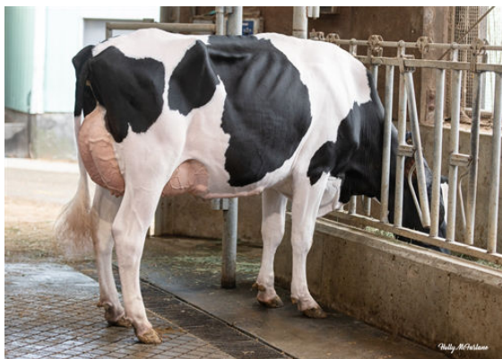
PROGENESIS MAGNIFIQUE PROUD