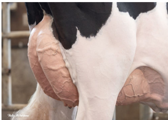
PROGENESIS MAGNIFIQUE PROUD