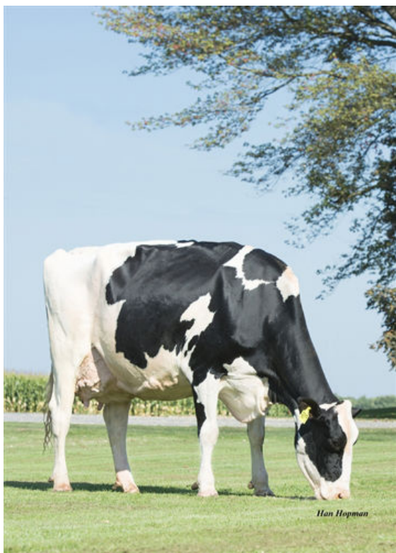
KINGS-RANSOM MG CLEAVAGE FOURTH DAM