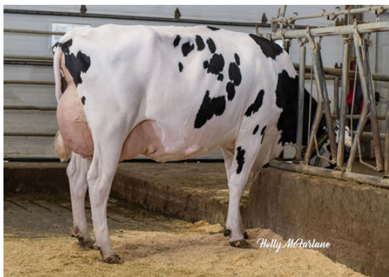
PROGENESIS JEDI MENACE FOURTH DAM