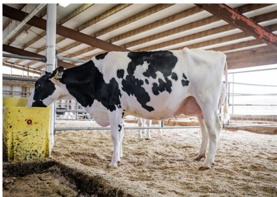
AOT DELUXE HI-LIGHTED