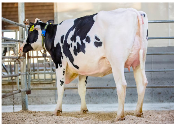
AOT DELUXE HI-LIGHTED