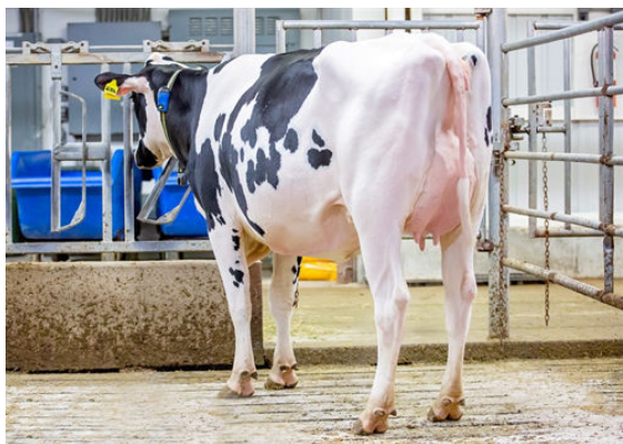
AOT DELUXE HI-LIGHTED