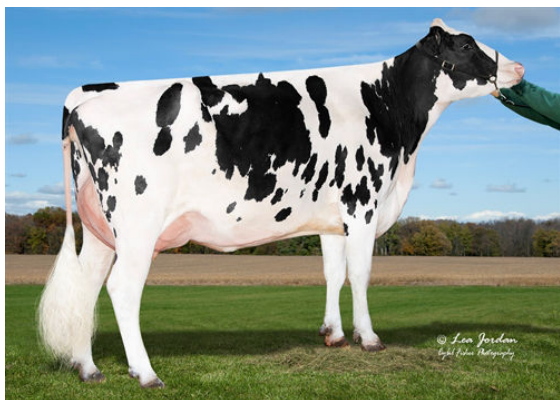
LA-CA-DE-LE CRIMSON MONA GRANDDAM