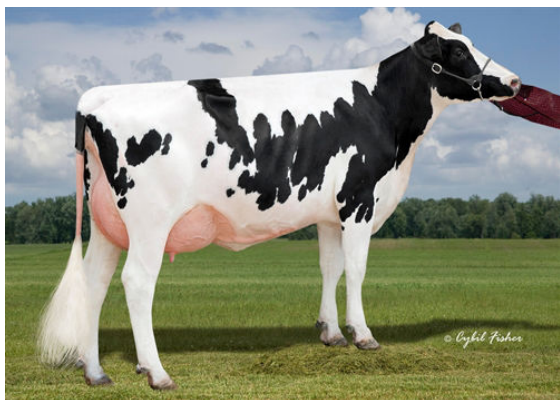
LA-CA-DE-LE CW MONA 8772 DAM