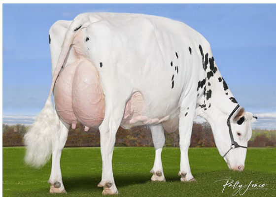
CALBRETT KINGBOY MIRANDA P GRANDDAM