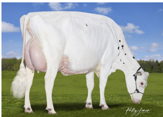
VOGUE LOYOLA MELINDA PP DAM