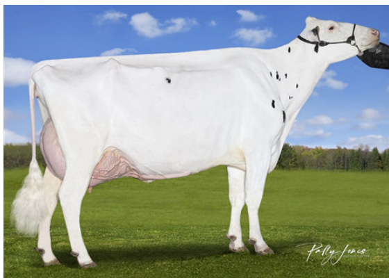
VOGUE LOYOLA MELINDA PP DAM