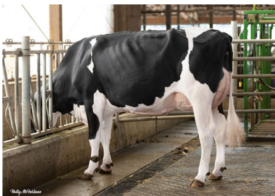
PROGENESIS EINSTEIN EVEN P