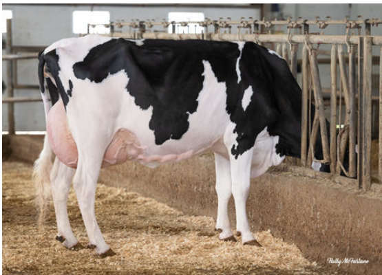
PROGENESIS ZAZZLE TWIGGY DAM