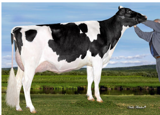
COMESTAR LATASHA TROPIC DAM