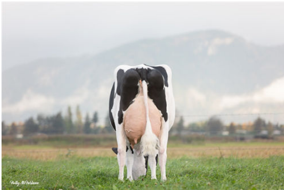
MYSTIQUE LAMBDA ANIS DAM