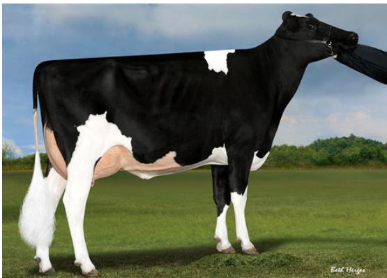
IHG LOTTOMAX TANIA FOURTH DAM