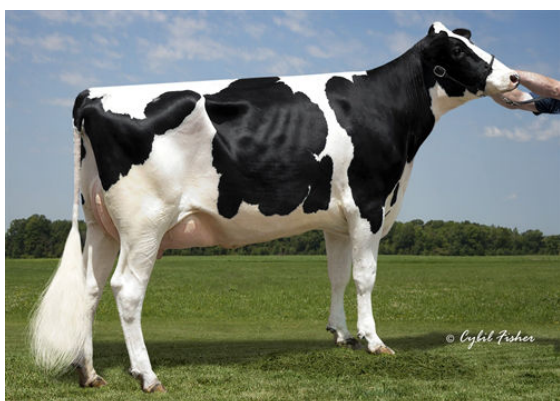
EDG RUBY UNO RAE 2054