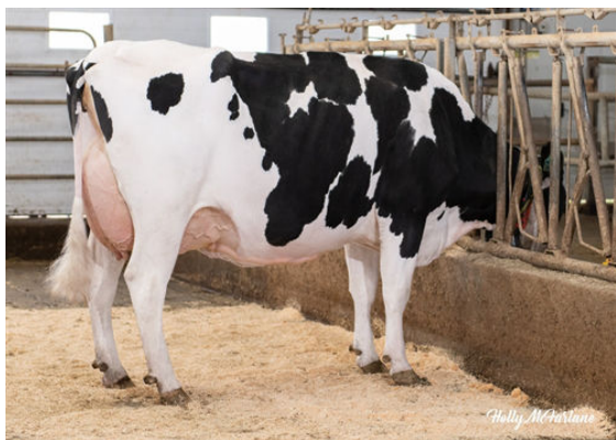
OCD LEGENDARY RAE