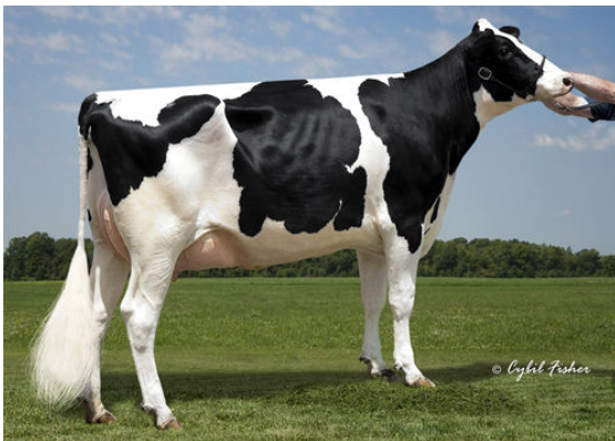
EDG RUBY UNO RAE 2054 FIFTH DAM