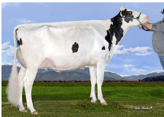
DICKLANDS KING DOC 3503