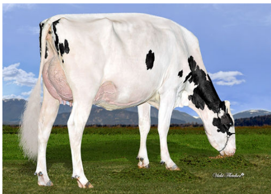
DICKLANDS KING DOC 3503