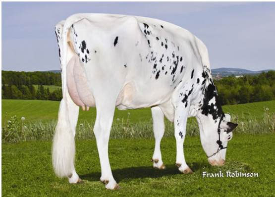
SUMMERLIZ MAN O MAN LAUSY FIFTH DAM