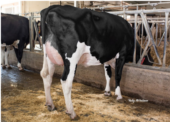
PROGENESIS OUTL WINTERBERRY GRANDDAM