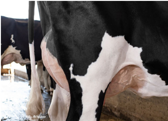
PROGENESIS OUTL WINTERBERRY GRANDDAM