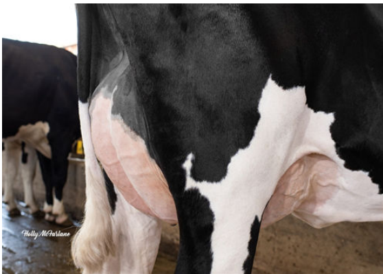
PROGENESIS OUTL WINTERBERRY GRANDDAM